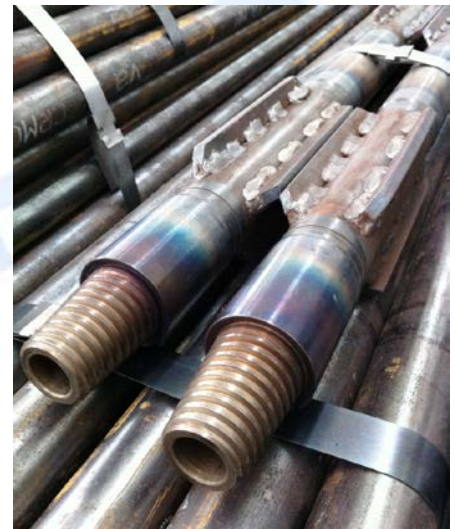
Reibgeschweisst 63,5 - NW Schaftrohr 60,3 x 7,1 mm